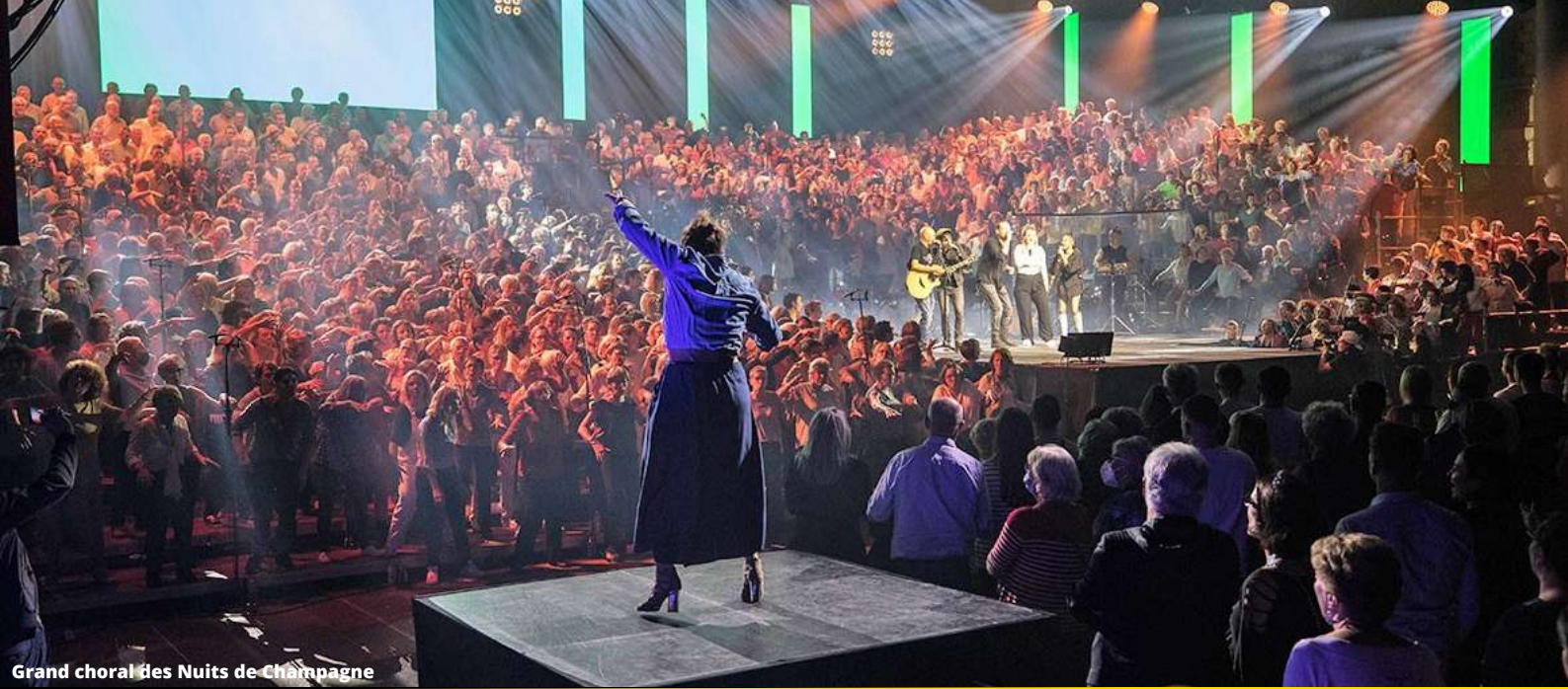
Grand choral des Nuits de Champagne