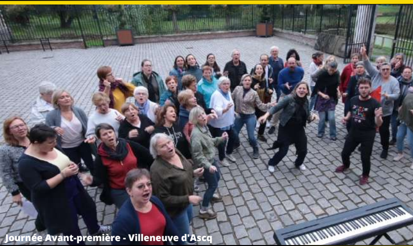
Journée Avant-première - Villeneuve d'Ascq