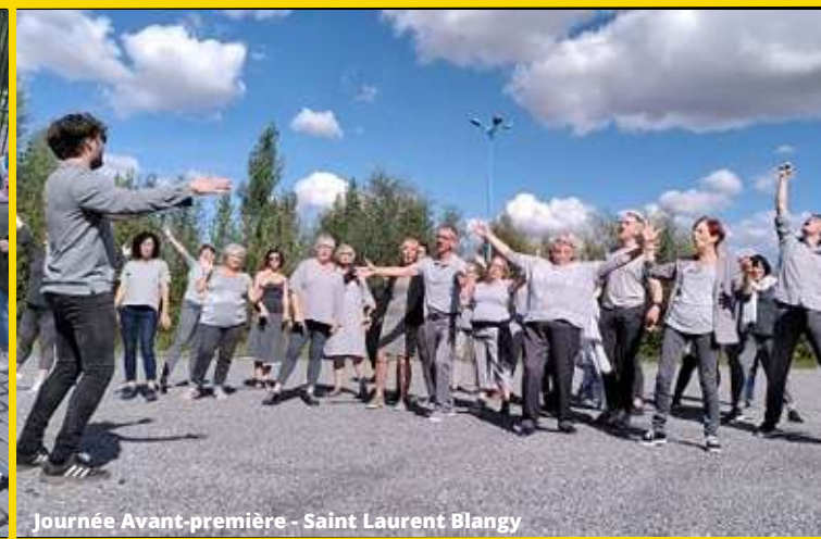
Journée Avant-première - Saint Laurent Blangy